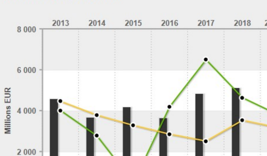
Evolution du Compte de Résultat